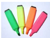
4 Surligneurs fluos (1 rose, 1 jaune, 1 bleu, 1 vert)