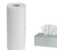
1 boîte de mouchoirs 1 rouleau d'essuie tout