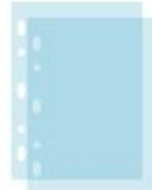
Pochettes transparentes perforées 21 x 29,7 cm