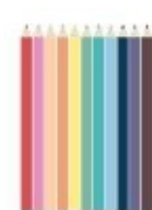
Crayons de couleur