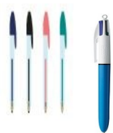
4 stylos à billes* (bleu, rouge, noir, vert) +1 stylo 4 couleurs