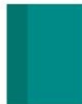
1 grand cahier 21 x 29,7 cm (pour les devoirs)