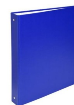
2 Classeurs A4