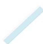
1 règle 30 cm (en plastique rigide )