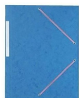
2 chemises cartonnées à élastiques